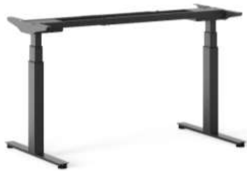
Elektrisch verstellbare FüÙe (dreistufige Säulen)