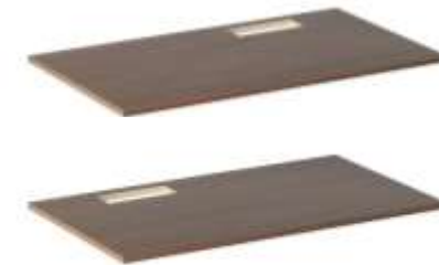
Länge der Tischplatte: 1200 / 1400 / 1600 / 1800* / 2000* mm Breite der Tischplatte: 700 / 800