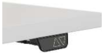
Taste UA mit Bewegung nach oben und unten mit 2 gespeicherten Positionen.