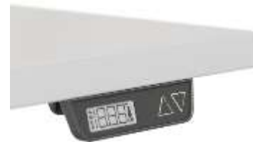
Taste VA mit Bewegung nach oben und unten mit 2 gespeicherten Positionen und einem Display.