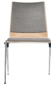
Sitz- & Rückendoppel