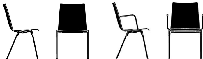
Sitzschale 51 aus Kunststoff