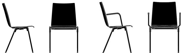
Sitzschale aus Buchenschichtholz, dreidimensional verformt, natur lackiert, unsichtbar befestigt