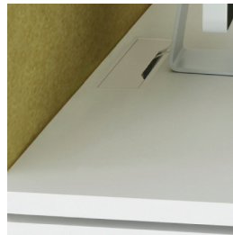
Schreibtisch mit Aussparung für Kabeldurchlass und Kabelführung