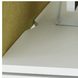
Schreibtisch mit Randeinkerbung für Kabelführung