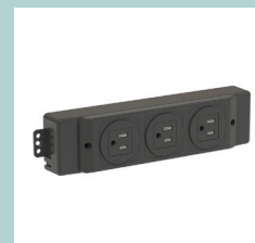
Steckdosenblock für Medien (EU, UK, FR, CH)