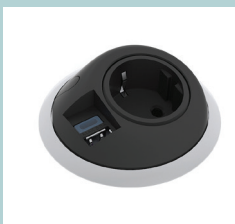
Steckdose SHZ004 (EU, UK, FR, CH)