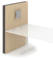
Medienwand* mit VESA-Halterung und rundem Kabelport mit \varnothing 60 mm aus Kunststoff unter der Tischplatte für Kabelmanagement - CMZ121