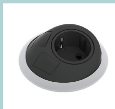
Steckdose SHZ005 (EU, UK, FR, CH)