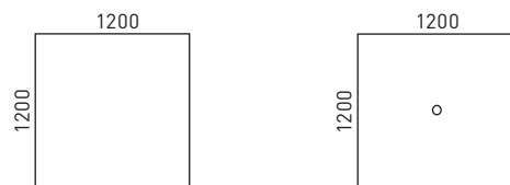
Höhenverstellbare Konferenztische mit Betonsockel